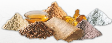
Die Bestandteile von Linoleum

Dabei überrascht die Linoleum Kollektion Linodesign mit natürlichen und ausdrucksstarken Holz- und Steindekoren